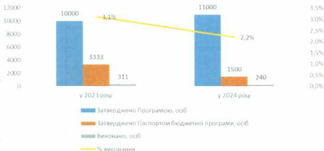
Аналіз показника продукту «кількість охоплених екскурсійними послугами».

Водночас спостерігається тенденція зростання запланованих обсягів фінансування, при цьому, показник ефективності залишився на вкрай низькому рівні, що вказує на потребу в удосконаленні підходів до організації та комунікації з цільовою аудиторією для зниження негативного впливу на соціальну підтримку ветеранів та підвищення довіри до міських цільових програм.